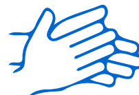
Pagkuskusin nang husto ang mga kamay