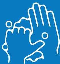
Tiyaking mahuhugasan nang mabuti ang mga balat