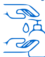
Maglagay ng pang-sanitize ng kamay

Kung walang sabon at tubig at walang nakikitang dumi sa mga kamay, Gumamit ng alcohol-based na pang-sanitize ng kamay na awtorisado ng Health Canada. Dapat subabayan ang mga mas batang mag-aaral kapag gumagamit ng mga pang-sanitize ng kamay.