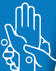
Patuloy na pagkuskusin ang mga kamay nang hindi bababa sa dalawampung segundo