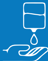
Gumamit ng likidong sabon o malinis na bareta ng sabon