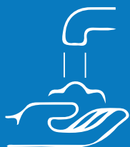
Basain ang mga kamay