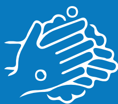
Pagkuskusin nang husto ang mga kamay