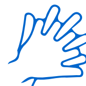
Ikuskos sa mga likod at palad ng mga kamay at sa pagitan ng mga daliri, sa palibot ng mga kuko, at sa mga pulsuhan