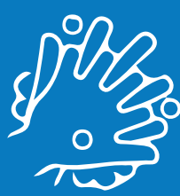
Bigyang-pansin ang mga bahaging palibot ng mga kuko at sa pagitan ng mga daliri