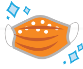
Deux masques propres