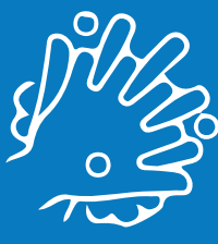
نظف بانتباه الأماكن المحيطة بالأظافر وبين الأصابع