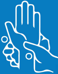
واصل فرك اليدين لمدة لا تقل عن 20 ثانية