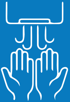
اشطف يديك بالماء وجففهما على النحو الملائم

إن استعمال الكمامات لن يُساعد وحده على الحد من انتشار فيروس كوفيد-19. عليك الالتزام بالاجراءات الوقائية الصحية والحفاظ على التباعد الجسدي في كافة الأوقات