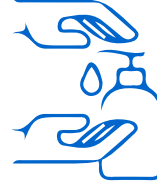
ضع كمية كافية من معقم اليدين