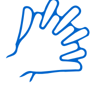
افرك ظهر اليدين والراحتين وبين الأصابع، وحول الأظافر والمعصمين