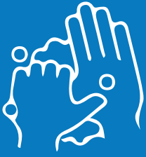
احرص على فرك جميع أسطح يديك بشكل كامل