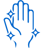
استمر في الفرك حتى تجف يديك