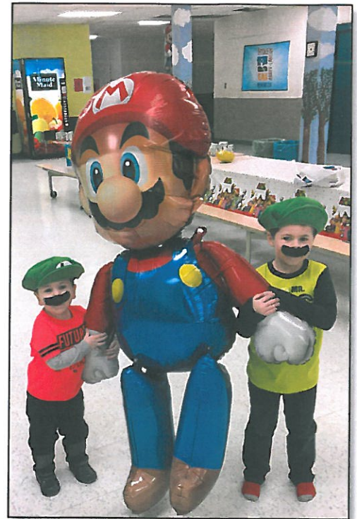
Fête qui a eu lieu au carrefour

Une fois l'entente de location conclue, un élève membre de l'entreprise communique avec le client pour identifier les besoins et pour établir les détails de la fête.